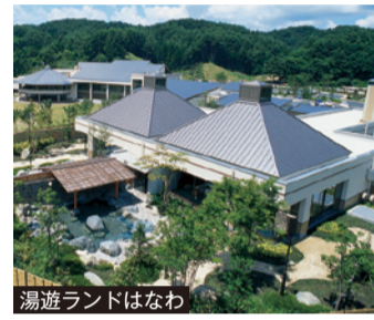
湯遊ランドはなわ